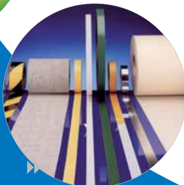
Une large gamme de produits techniques.