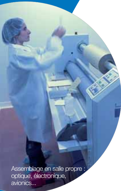
Assemblage en salle propre : optique, électronique, avionics...