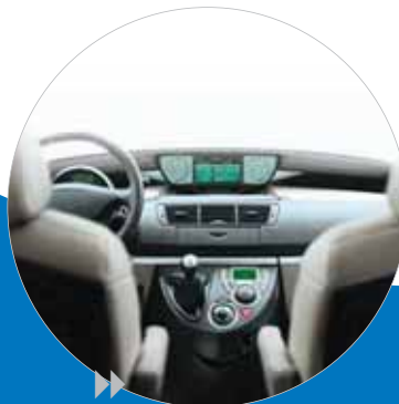
De nombreux produits et solutions qualifiés pour l'automobile.